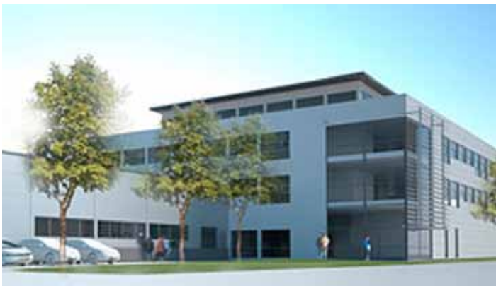
Honda Head Office, Malmö, Sweden