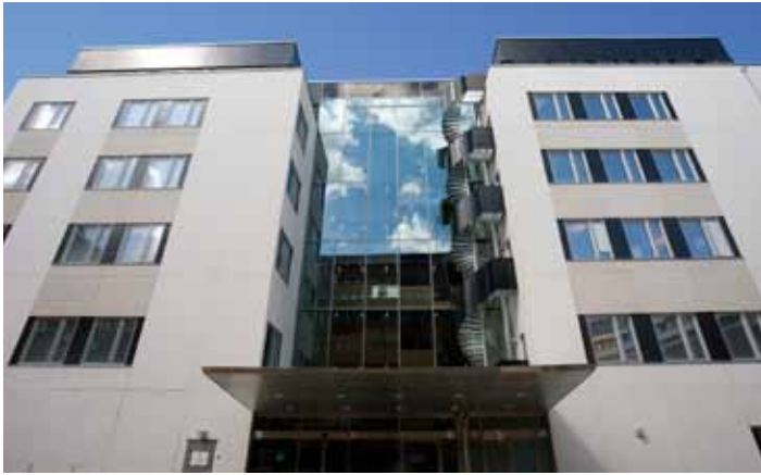
Västerport, Stockholm, Sweden