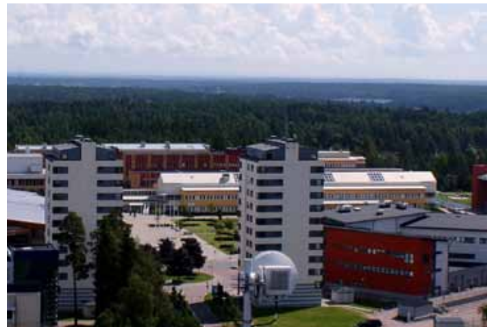
Karlstad University, Sweden