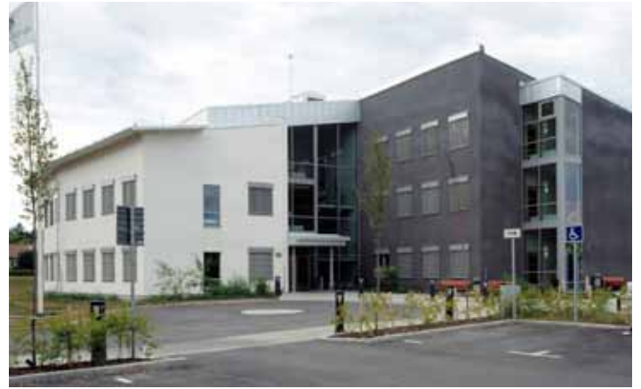
Akademiska Hus, Uppsala, Sweden